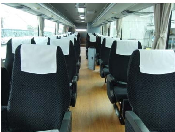
3列シート部(「エアロエース」)