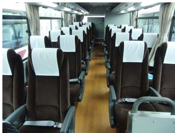
4列シート部(「ガーラ」)