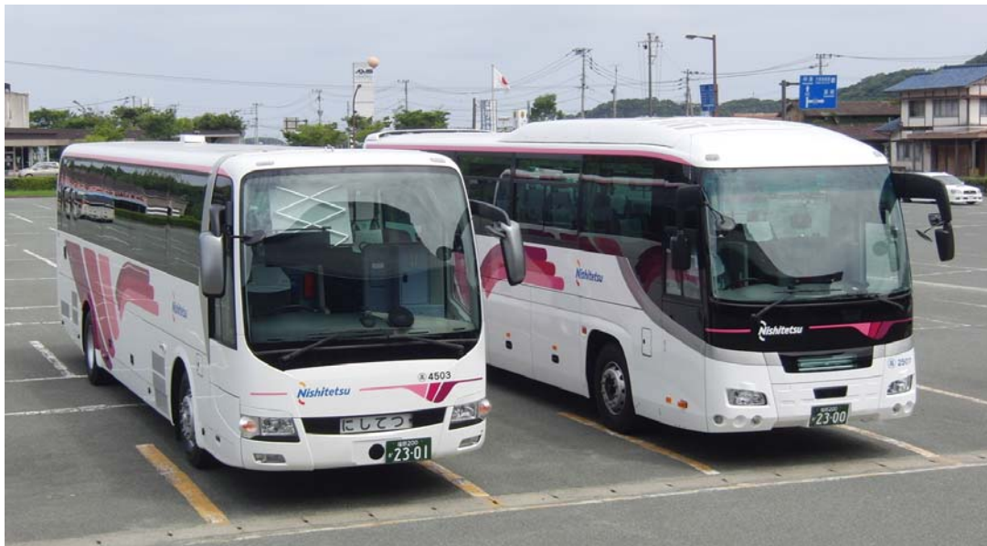
「フェニックス号」新型車両外観（左:「エアロエース」 右:「ガーラ」）