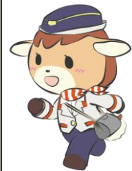
協会マスコットキャラクター「ミーカ」