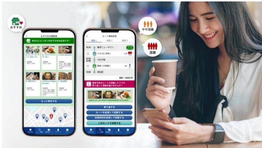
Web アプリ画面イメージ

株式会社日立製作所(以下、日立)と西日本鉄道株式会社(以下、西鉄)は、安心・安全で快適な移動と経済の活性化の両立をめざして、日立独自の「ナッジ応用技術」を活用し、公共交通機関利用者の行動変容を促す2回目の実証実験「安心快適なおでかけサポート実証実験」(以下、本実証実験)を2月1日から3月7日まで実施します。