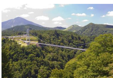
九重”夢”大吊橋(大分県玖珠郡)