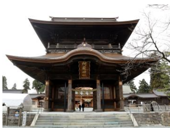
阿蘇神社(熊本県阿蘇市)

THE RAIL KITCHEN CHIKUGOの詳細は こちら 特急 かわせみ やませみの詳細は こちら