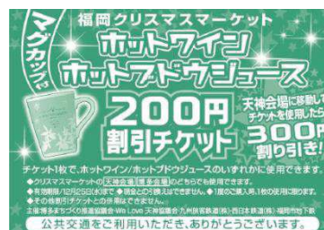
博多会場にて進呈

【配布期間】12月のクリスマスマーケット期間中の土・日 12/1(日).7(土).8(日).14(土).15(日).21(土).22(日)