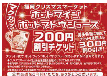
天神会場にて進呈