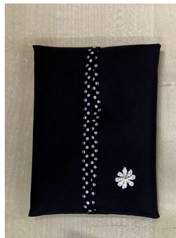
<ティッシュケース>