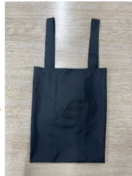
<完成品(エコバッグ)>