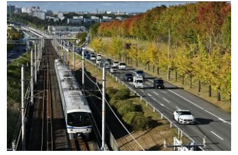
keco (泉北高速鉄道株式会社)