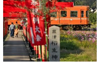
はらちゃん(puratanasu) @puratanasu1985 (一畑電車株式会社)