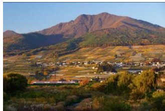
大川 賢一 (長野電鉄株式会社)