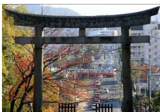
佐竹 幸洋 (高松琴平電気鉄道株式会社)