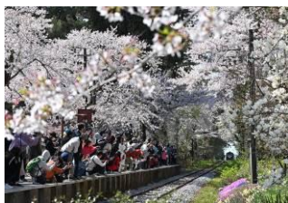
しまおか@shimaoka4 (津軽鉄道株式会社)