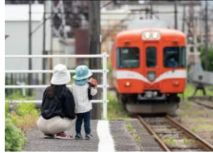
守谷 恵介 (岳南電車株式会社)