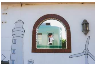
はつかり・がっかり @kiha55_kiha45 (銚子電気鉄道株式会社)