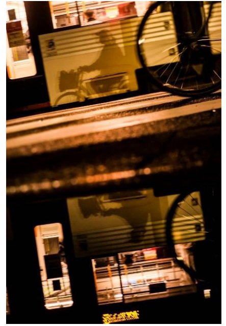
すや@sss87005532 （広島電鉄株式会社）