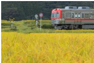
池線の人 (北陸鉄道株式会社)