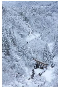
区長@t_kucho (富山地方鉄道株式会社)