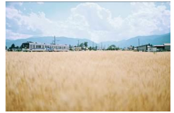
罷 (アルピコ交通株式会社)