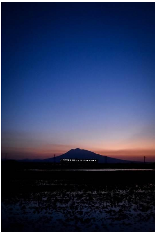
岩淵 蒼生 (弘南鉄道株式会社)