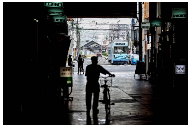
すたーらいと （岡山電気軌道株式会社）