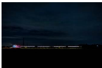
浅見 哲哉 (秩父鉄道株式会社)