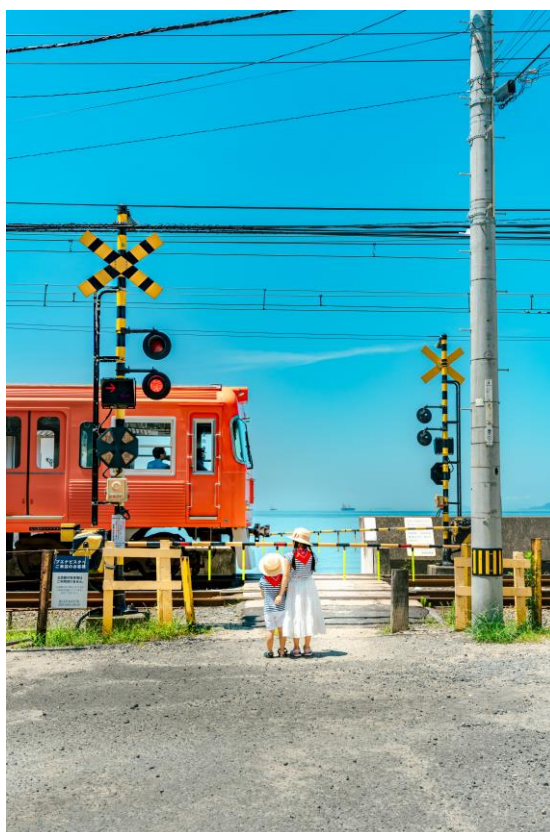
TOMO (伊予鉄道株式会社)