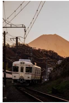
駒ノ木(仮乗降場) @Koma_temp_sta (富士山麓電気鉄道株式会社)