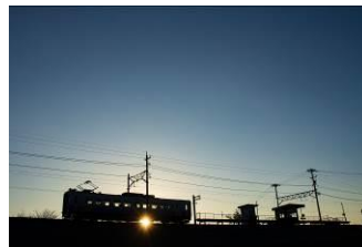
北陸のてっちゃん (えちぜん鐵道株式会社)