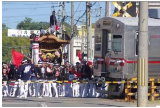
みすた亭 (水間鉄道株式会社)