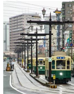
K E N@kenbou187031 (長崎電気軌道株式会社)