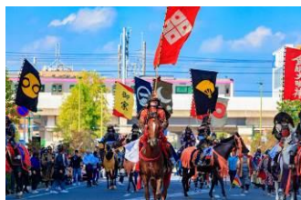
たけじえーさん /Take_jp@Take_jp_photo (新京成電鉄株式会社)