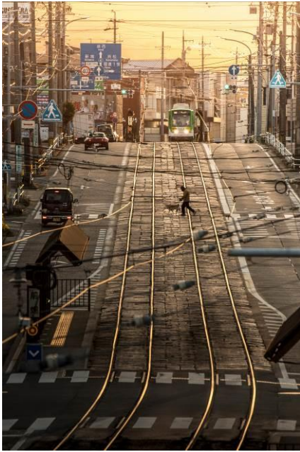
中村 哲也（てっぴー） （豊橋鉄道株式会社）