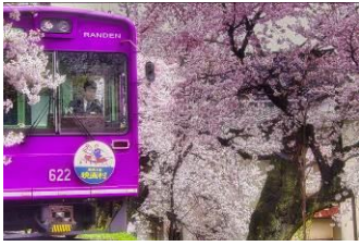
GAYOSHI (京福電気鉄道株式会社)