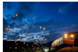
れかる@RECARO_typeR (小湊鐵道株式会社)