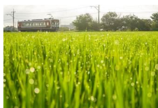
彩奈 Style 2021 @forever_saika (上信電鉄株式会社)