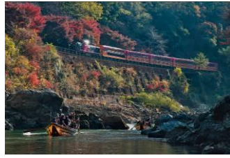
遠藤 聡 (嵯峨野観光鉄道株式会社)