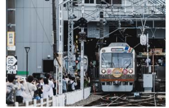
吉川美南@YoshiMina102 (静岡鉄道株式会社)