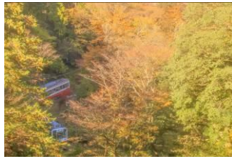
こと葉 (株式会社小田急箱根)