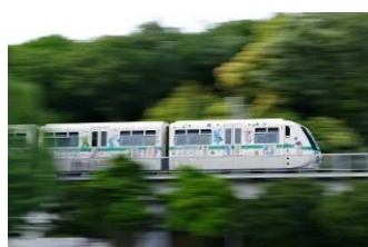
かしわもち (山万株式会社)