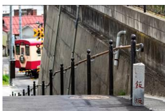
hirokuro (福島交通株式会社)