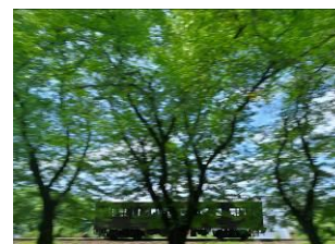
高草木 裕子 (上毛電気鉄道株式会社)