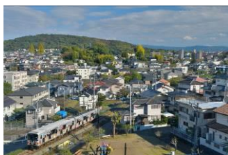
haruki (熊本電気鉄道株式会社)