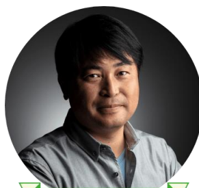
プロカメラマン審査員