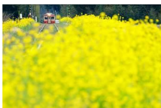
石合 純夫 (いすみ鉄道株式会社)