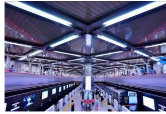
masa. kur i (北大阪急行電鉄株式会社)