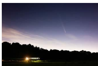
おらが湊鐵道応援団 @keha601 (ひたちなか海浜鉄道株式会社)