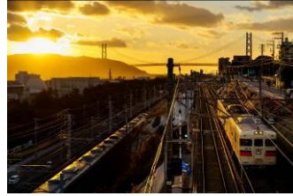
ヨコ (山陽電気鉄道株式会社)