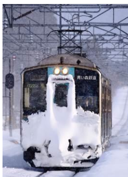
蛭名 雄輝 (青い森鉄道株式会社)