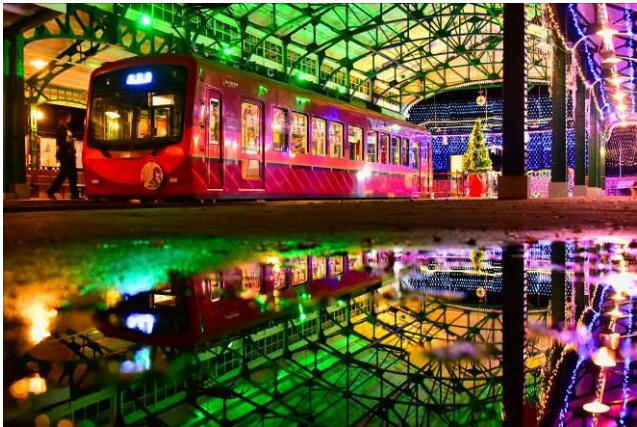
西 正幸 （叡山電鉄株式会社）