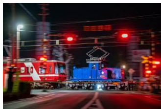
あゆ@ayu_0x0 (遠州鐵道株式会社)