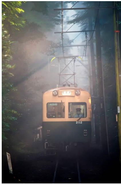
櫛原 良三 （三岐鉄道株式会社）