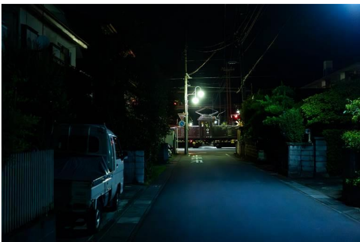
はこなん行き (伊豆箱根鉄道株式会社)