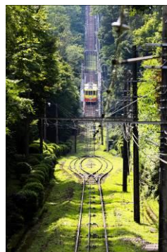
大塚 怜 (高尾登山電鉄株式会社)