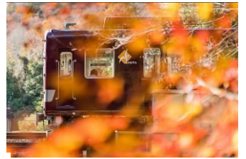
トークン@Token_Picture (能勢電鉄株式会社)