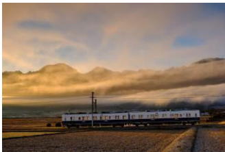
西沢 浩平 (上田電鉄株式会社)