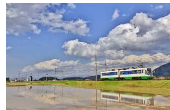
なご葱豆腐@dkbukoro (福井鐵道株式会社)