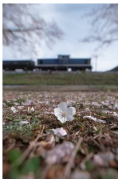
まっしぐら@KW10_KK04 (岩手開発鉄道株式会社)