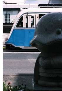
ヤゴクレ@illust8590 (とさでん交通株式会社)