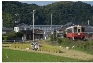
寺田 裕一 (紀州鉄道株式会社)