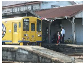
かむら@nantokamura (島原鉄道株式会社)