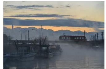
岡部 陽三 (万葉線株式会社)