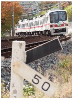
welcome_shinyu (神戸電鉄株式会社)