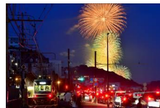
みやちゃん (江ノ島電鉄株式会社)