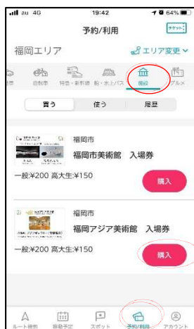
予約/利用画面からチケットを購入・決済