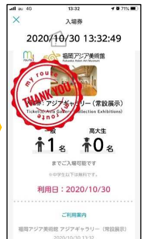
係員に見せて「非接触」入場！