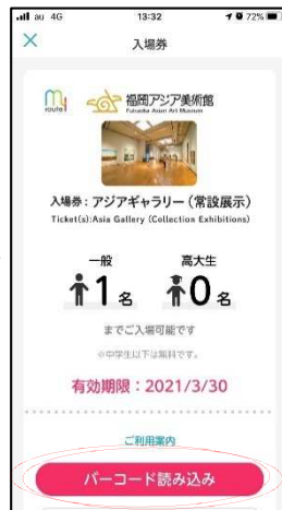
アプリ内の入場券から、当日窓口にて二次元コード読み込み