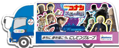
2号車:劇場版『名探偵コナン 黒鉄の魚影(サブマリン)』 4月14日(金)公開