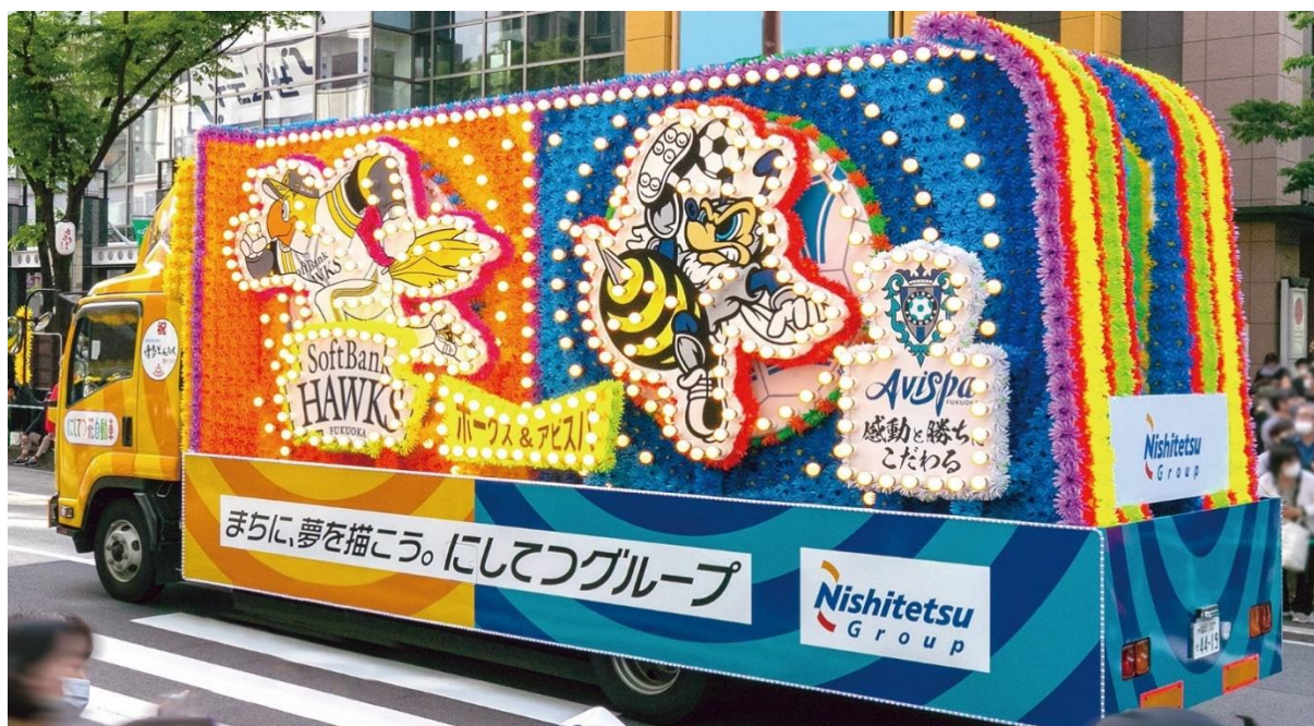
3号車:頂点を目指してはばたけ! ホークス&アビスパ