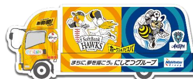
3号車:頂点を目指してはばたけ！ ホークス&アビスパ