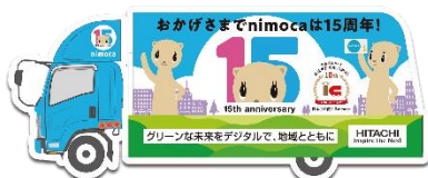
1号車:おかげさまで nimoca は 15 周年！