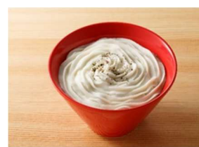
白カレーうどん 等