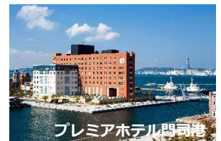
プレミアホテル門司港