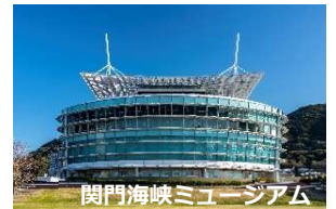
関門海峡ミュージアム