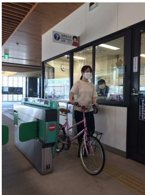
エレベーターや階段を利用して改札口まで移動