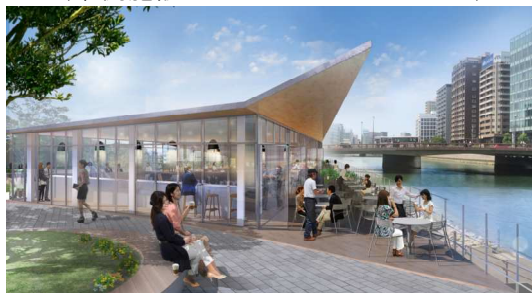
(東側施設:HARENO GARDEN EAST)