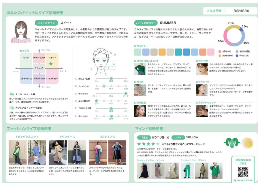
<診断結果イメージ>