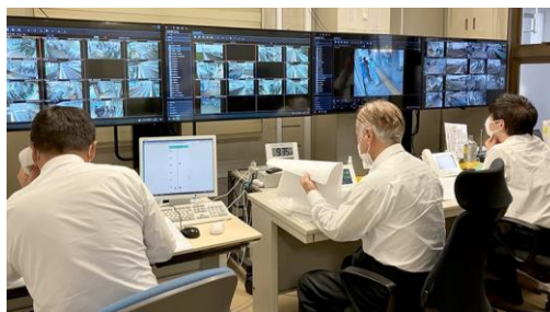
<柳川サポートセンター>

<概要> 大型モニター設置のサポートセンターにて、専属係員が各駅設置のインターホンを通じてお客さまからの問い合わせ対応を行うほか、監視カメラを通じて改札付近の状況確認やホームの安全確認を行います。