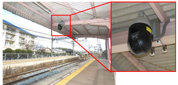
<駅ホーム設置の監視カメラ>