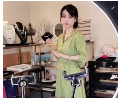
専属ライバーによる ライブ配信(イメージ)