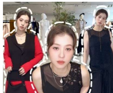
中国のお客さまに向けた SNS投稿(イメージ)

OMAKASE Liveの紹介動画をご覧ください！ ご視聴はこちらから⇒ https://youtu.be/ndLWHnt-5Xs