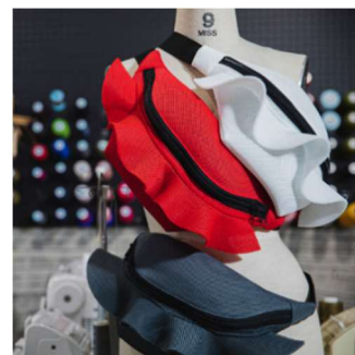
バッグ「gMbD.」((同)ケイトリメル)