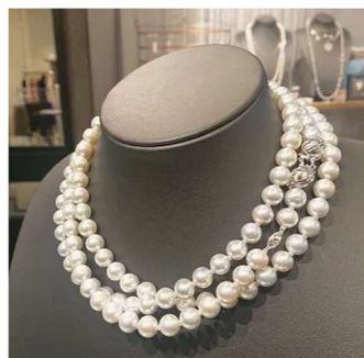
真珠「ACCO」 (株)ホライインターナショナル)