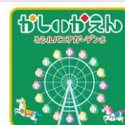
オリジナルヘッドマーク

駅窓口または西鉄お客さまセンター（TEL0570-00-1010 または 092-303-3333）にお尋ねください。