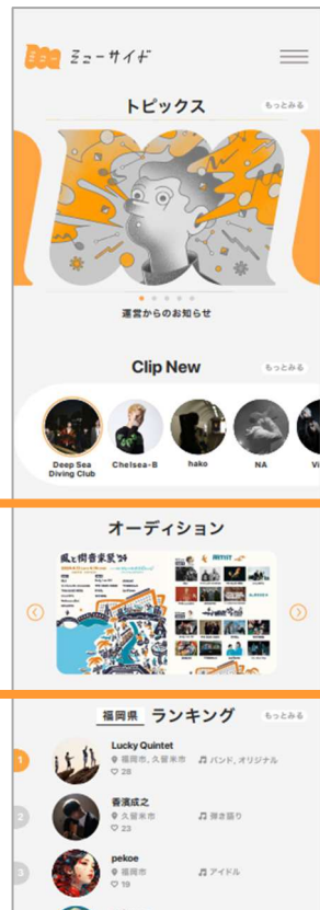
【アプリトップ画面】