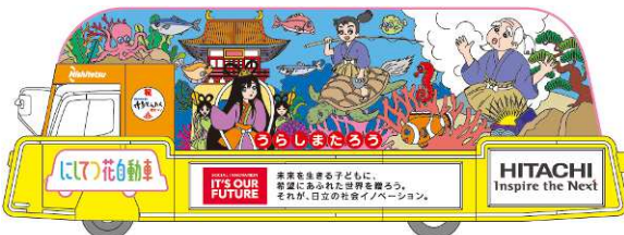
A編隊3号車 うらしまたろう