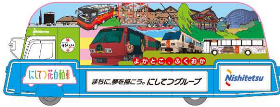
A編隊1号車 よかとこ、ふくおか