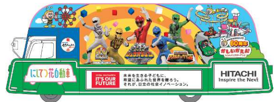
B編隊2号車 かしかえん60周年/動物戦隊ジュウオウジャー