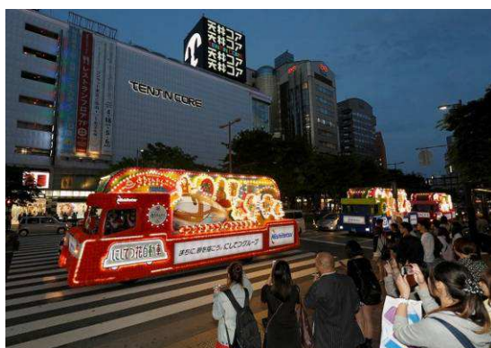
にしてつ花自動車(昨年の様子)