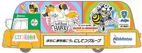
B編隊3号車 まつりでGo!GO!/がんばれ! ホークス&アビスパ

【担当運転士】 下記 8 名(男性:6 名、女性:2 名)の西鉄バス運転士が交代で乗務いたします。