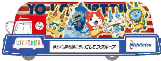
A編隊2号車 妖怪ウォッチ