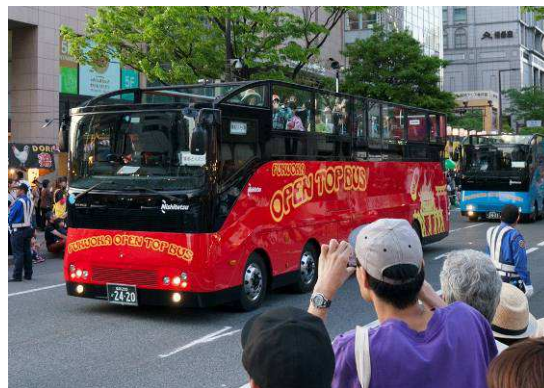
福岡オーブントップバス(昨年の様子)

本件に関するお問い合わせは、西鉄お客さまセンター(Tel0570-00-1010) まで