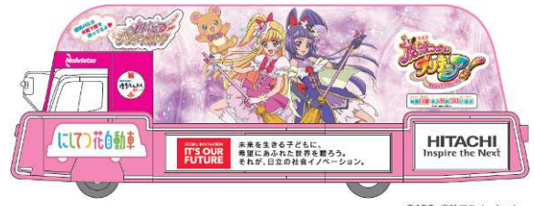
B編隊1号車 魔法つかいプリキュア