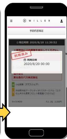
乗車時はそのままご乗車いただけます。降車時に、マイページの予約画面をご提示ください。未入金の場合はボタンが表示されません。