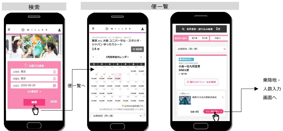
利用の区間、出発日を選択。※便の指定、座席の確保はできません。

1カ月月先の乗車日分まで購入可能。1購入につき9人分まで決済可能。それ以上の購入をご希望の場合は、WILLER 予約センターに電話連絡。