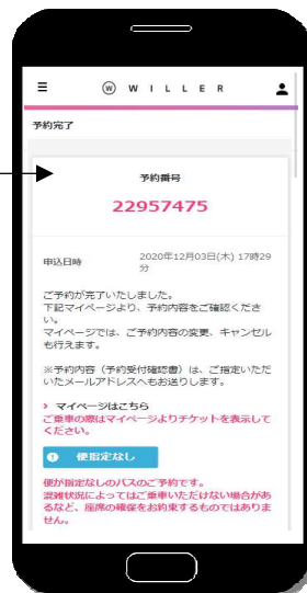
予約内容を確認後、クレジットカード決済、コンビニ決済、もしくはキャリア決済にてお支払いいただき、予約完了となります。