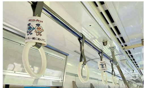
掲出イメージ(西鉄天神大牟田線開業100周年記念ラッピング電車の車内)