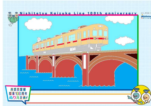
ぬりえポスターイメージ

みそら保育園の園児(年長組)が西鉄貝塚線の電車や運転士、沿線風景のぬりえに色を塗った「ぬりえポスター」を、中吊りポスター枠に掲出します。