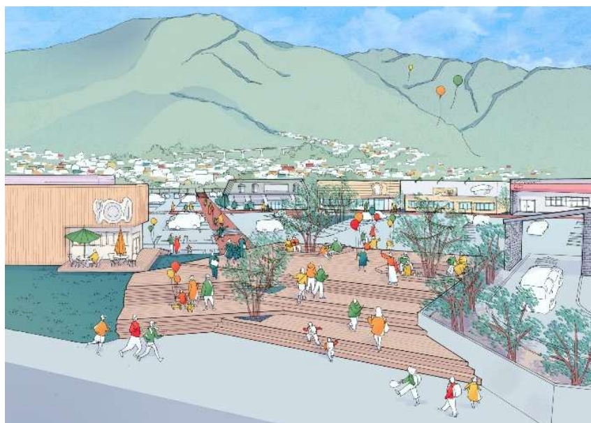
「皿倉テラス」イメージパース