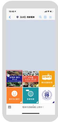
リッチメニューを選択