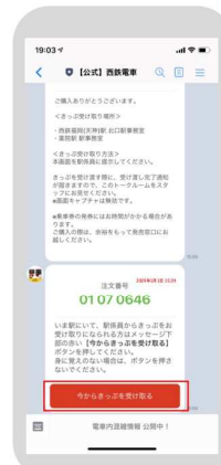
お客様自身でタップ