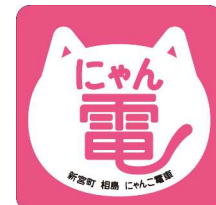
オリジナルヘッドマーク