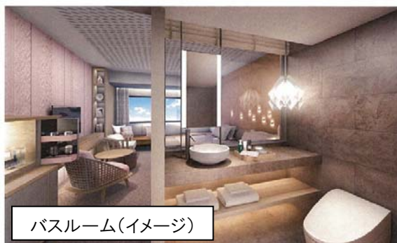
バスルーム(イメージ)