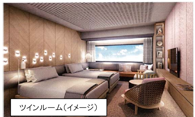
ツインルーム(イメージ)