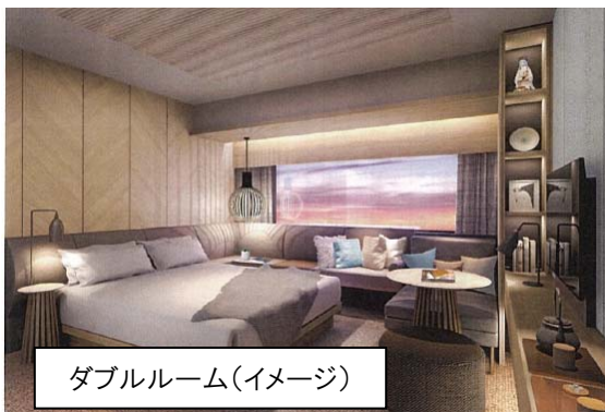
ダブルルーム(イメージ)