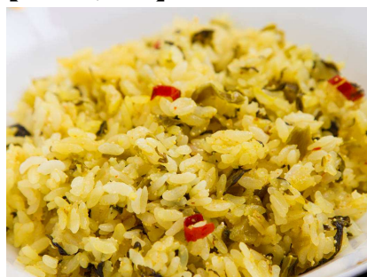
大自然の阿蘇の味 ピリッと辛い「スペシャルたかなライス」 (ソラリア西鉄ホテル・トランスブルー)