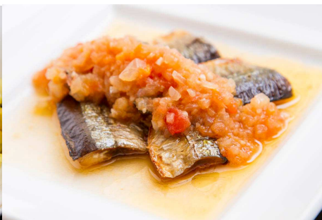
さんまのシャレットローガ (ソラリア西鉄ホテル・トランスブルー)