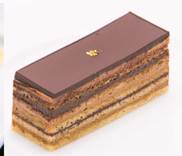
天下一品 荒岩流オペラ (西鉄グランドホテル ル・プティパレ)