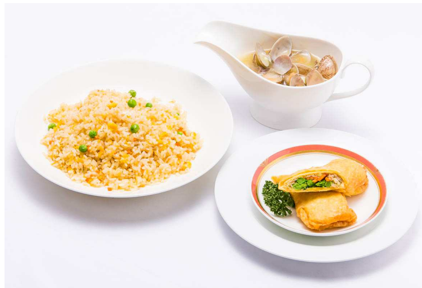
『栄養満点！ボリュームたっぷり!! トロトロチャーハン』 &『クルクルあでやかなお惣菜 卵の春巻き』ランチセット (西鉄グランドホテル・桃林)