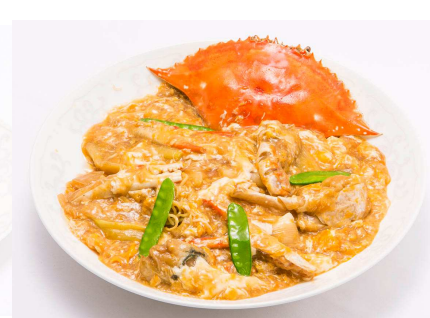
ワタリガニの卵とじ炒め (西鉄グランドホテル・桃林)