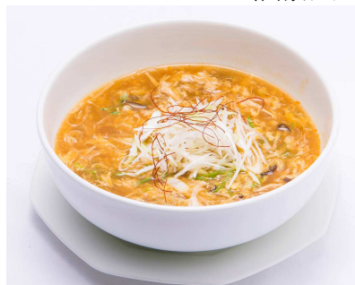
スッパカラウマ酸辣ビーフン (西鉄グランドホテル・桃林)