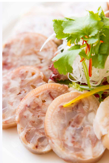
コラーゲンたっぷりトソクハム (西鉄グランドホテル・桃林)