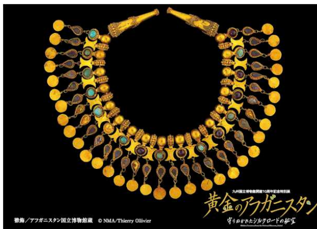
【ポストカードイメージ】