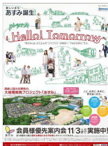
ポスターイメージ