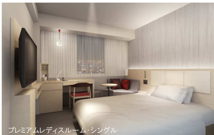
プレミアムレディスルーム・シングル