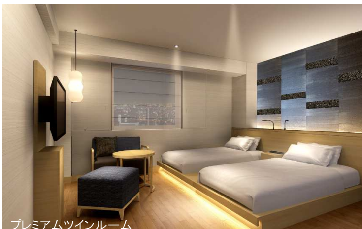
プレミアムツインルーム