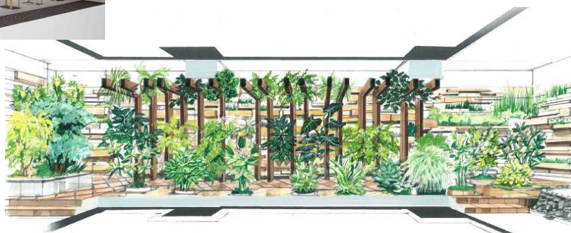
浴場から眺める庭園