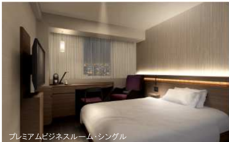
プレミアムビジネスルーム・シングル