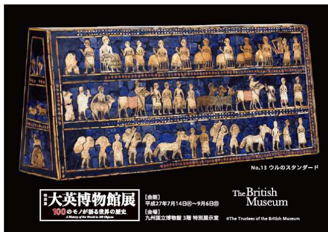
(特製ポストカードイメージ)