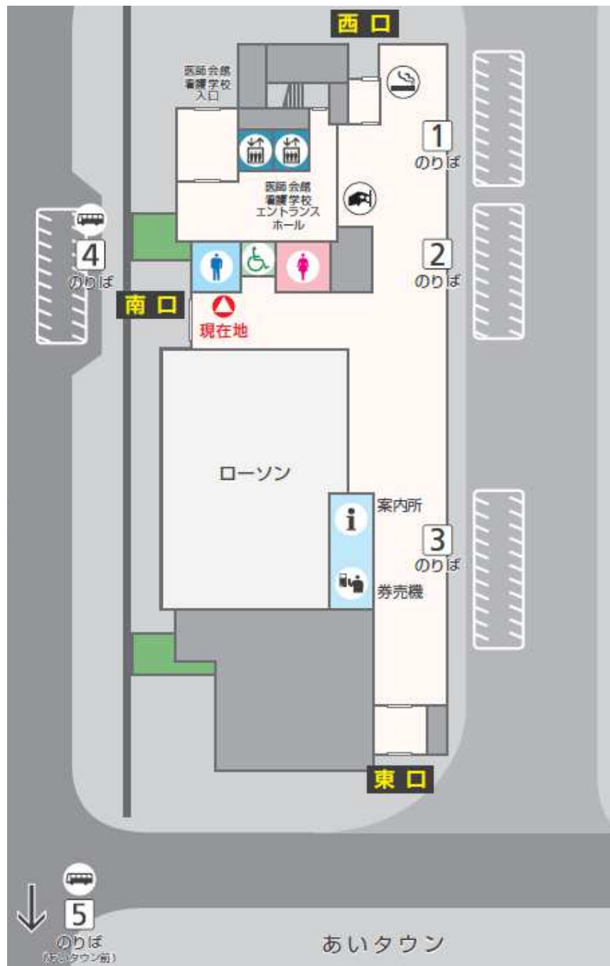
【のりば名称・乗り入れ路線】