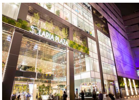
▲南側(警固公園側)外壁