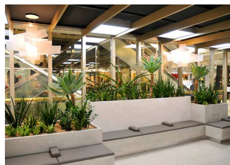
▲休憩スペース(エスカレーター横)