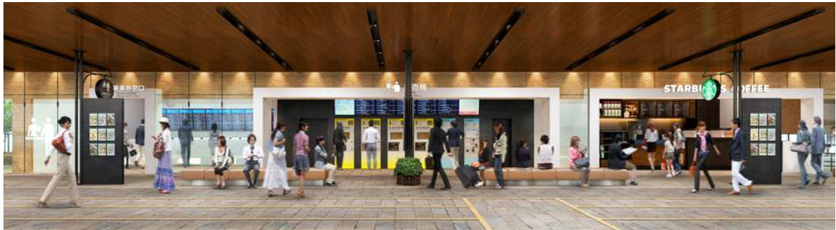
▲西鉄天神高速バスターミナル(乗車場)