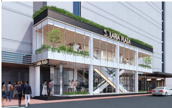
ソラリアプラザ(左:エスカレーター棟、右:地下2階)▼