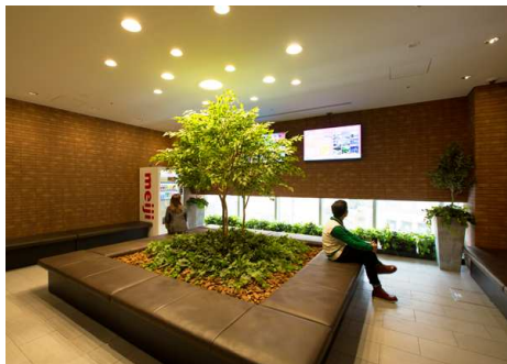
▲室内型待合ブース