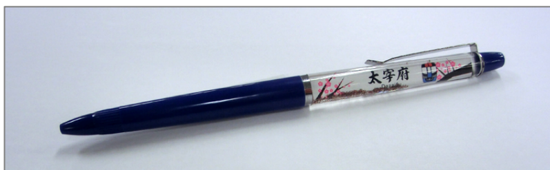
特典②西鉄電車オリジナル「合格ボールペン」

この件に関するお問い合わせは、西鉄お客さまセンター(TEL0570-00-1010) まで