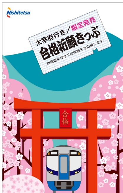
西鉄電車 太宰府行き「合格祈願きっぷ」