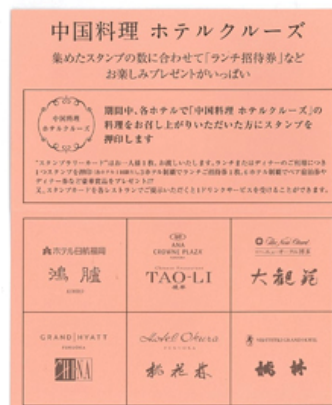
スタンプカード(見本)

***** 本件に関するお問い合わせ先 ***** 西鉄グランドホテル 営業企画課 〔〒810-8587 福岡市中央区大名二丁目 6-60 TEL:092-781-0811〕