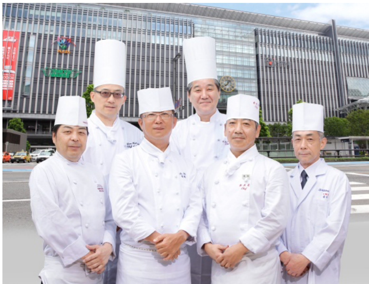
共同企画イメージ写真

【限定企画】 《スタンプラリー》 ①イベント開催期間中に、対象店舗(ホテル)にてランチ・ディナーいずれかをご注文の方に、スタンプカードを進呈します。 ②対象の6店舗のうち3店舗をご利用いただいたお客さまには、いずれかのホテルでご利用可能なランチ券を、6店舗すべてご利用いただいたお客さまには、ディナー券や宿泊券などをプレゼントいたします。 ◎さらに、各店舗にてスタンプカードをご呈示いただくと、ワンドリンクサービスをさせていただきます。