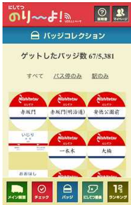
バッジコレクション

...チェックイン・アウトすると、乗り降りした駅の「駅名標」やバス停の「標板」のバッジ(画像)がもらえる。バッジの数は 5,000 種類以上。たくさん乗車して「バッジコレクション」を集めよう。