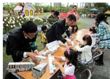
ペーパークラフト&ぬりえコーナー