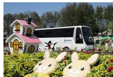
夜行高速バスの展示

夜行高速バス、福岡シティループバス「ぐりーん」といった西鉄バスを象徴する車両を展示し、バス車内の運転席などをご覧いただけます。