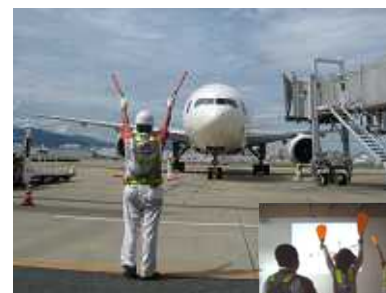
マーシャリング体験

作業帽・安全ベスト・ヘッドホン・パドルを着用し本番さながらの格好で、映像を使ってマーシャリング(航空機の誘導)を楽しむ体験していただけます。