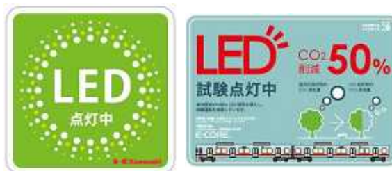
車両内掲出ステッカー