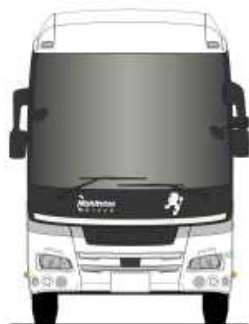
【西鉄高速バス(株) 車両デザイン】