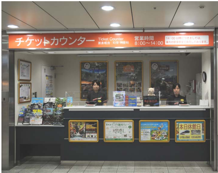
〔8:00~14:00〕 西鉄電車 チケットカウンター