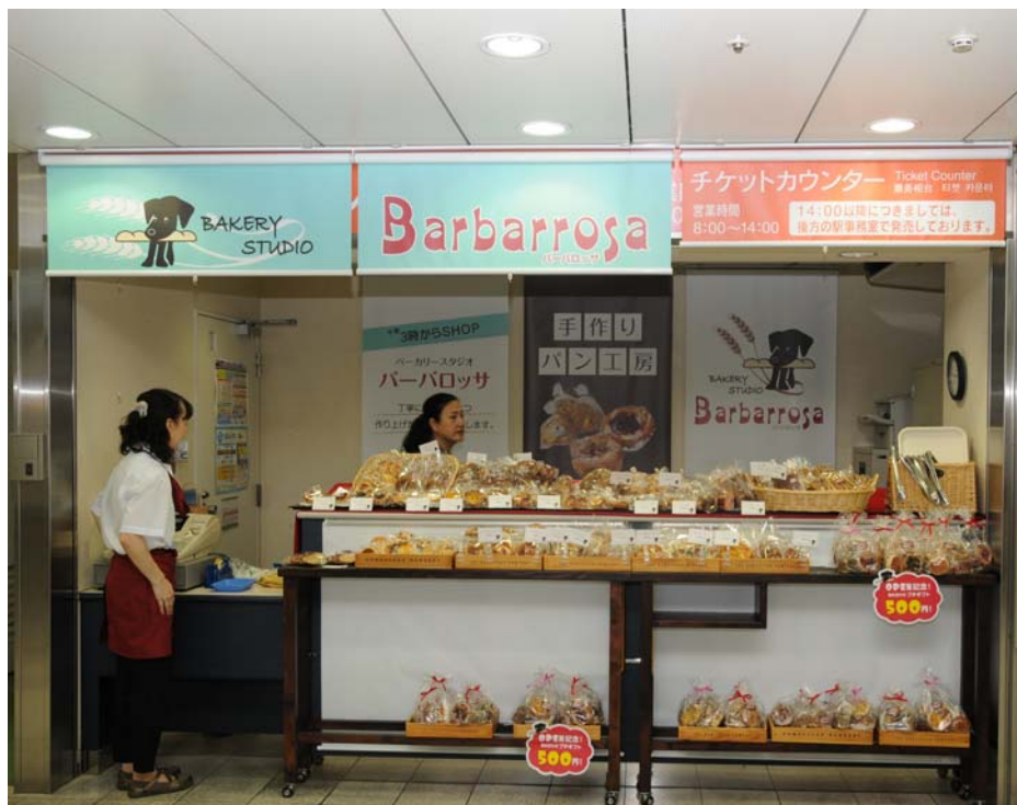
〔15:00~21:30〕 ベーカリー『バーバロッサ』