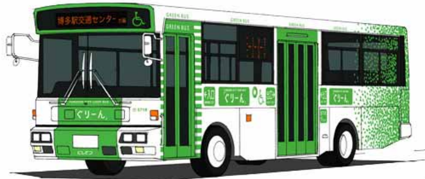
車両外装(全車共通)