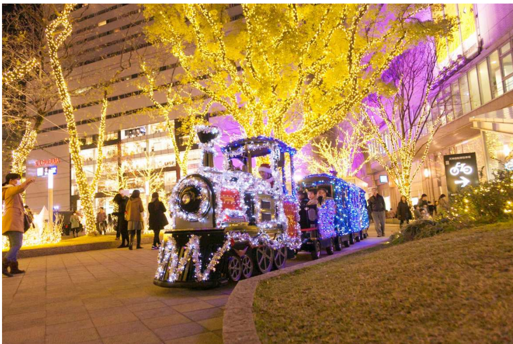
過去運行時の様子