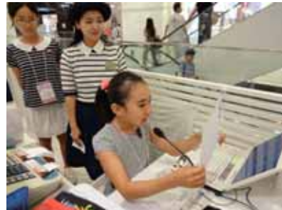
昨年の体験の様子