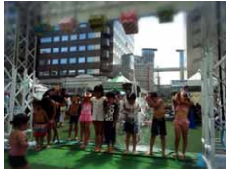
過去の会場の様子