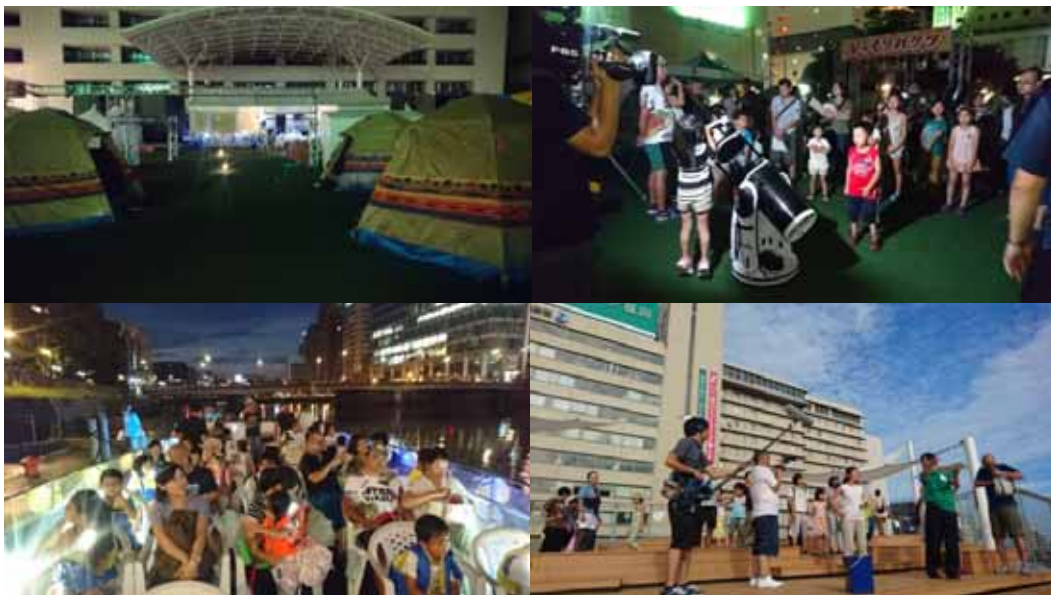
昨年の体験の様子