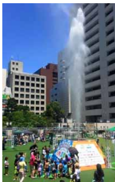
ウォーターキャノン