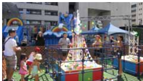
スプラッシュタワー