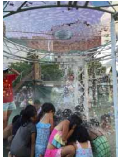
ときどきバルーン