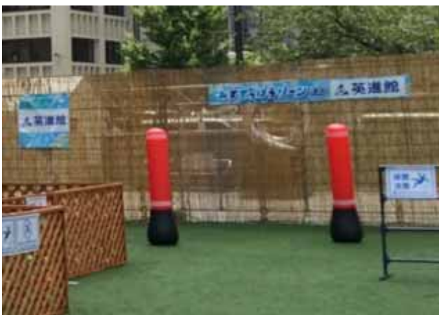
みずでっぼうゾーン イメージ