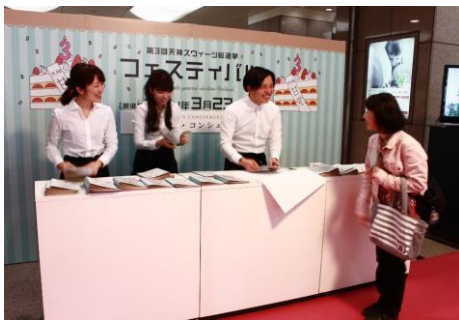
第3回 天神スイーツ総選挙活動 イベント(スイーツ総選挙フェスティバル)の様子