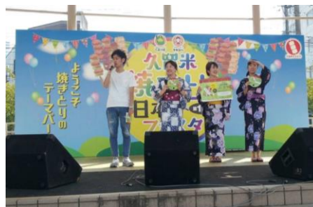
天神やきとり総選挙活動 PR 活動(久留米焼きとり日本一フェスタ参加)の様子

この件に関するお問い合わせは、西鉄お客さまセンター(Te0570-00-1010) まで