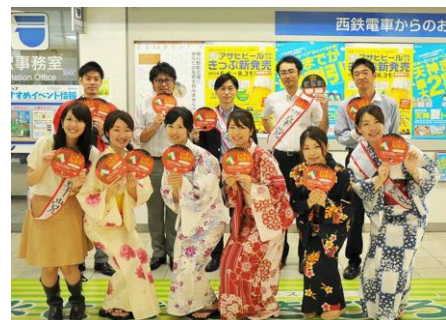
天神辛メシ総選挙活動 PR 活動(うちわ配り)の様子