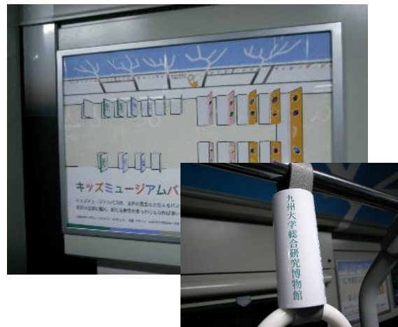
図4：つり革や車内の壁面を利用してメッセージを発信