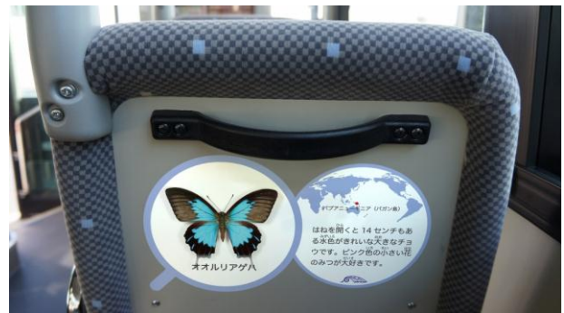
図2：座席背面に貼られた昆虫の生態等について解説するステッカー。