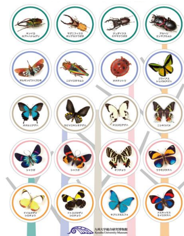
図5：子どもたちが自由に持ち帰ることができる昆虫のステッカーシート(A4)。