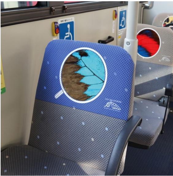
図1：座席背もたれのカバーには、昆虫の部分写真をプリントした。