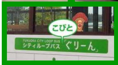
こびとぐりーん (車体装飾イメージ)