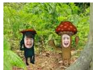
AR技術体験イメージ