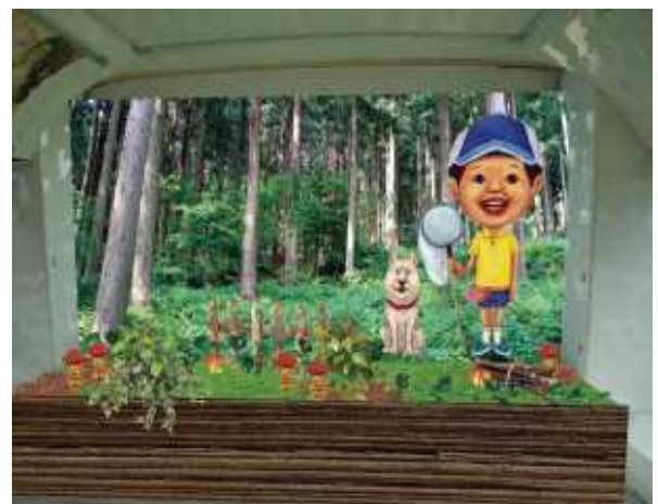
後部座席後ろ(装飾イメージ)

上記期間中は、小学生のお子さまが無料でご乗車いただける「夏休みこども無料キャンペーン」も同時開催します。こびとぐりーんに乗って、福岡の観光地をご堪能ください。