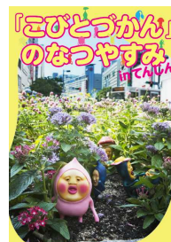
天神オリジナル こびとのポストカード (イメージ)