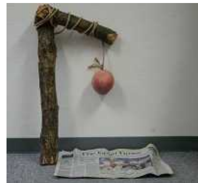
こびと捕獲キット

こびとの捕獲キット(手段・道具)を展示します。 天神にひそむこびとを捕まえるために、捕獲方法をしっかり学べるスペースを作ります。