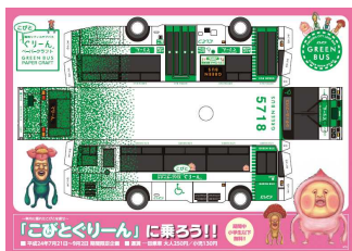
「こびとぐりーん」 ペーパークラフト