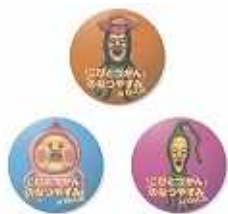
オリジナル 缶バッジ