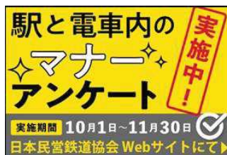
マナーアンケート回答画面へのリンクバナー