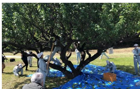
福農生による梅収穫の様子