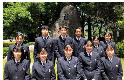
今回携わってくださった、福岡農業高等学校の皆さま