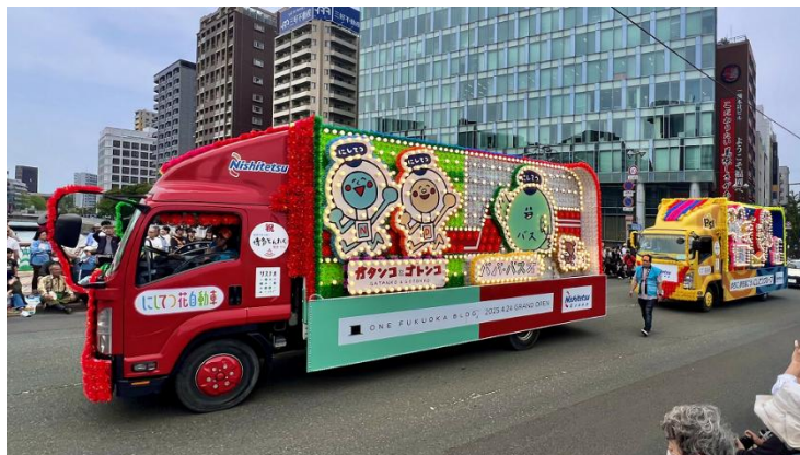
昨年の運行の様子

※2「トイ・ストーリー」シリーズ最新作の『トイ・ストーリー5』は、7月3日(金)から全国劇場公開されます。