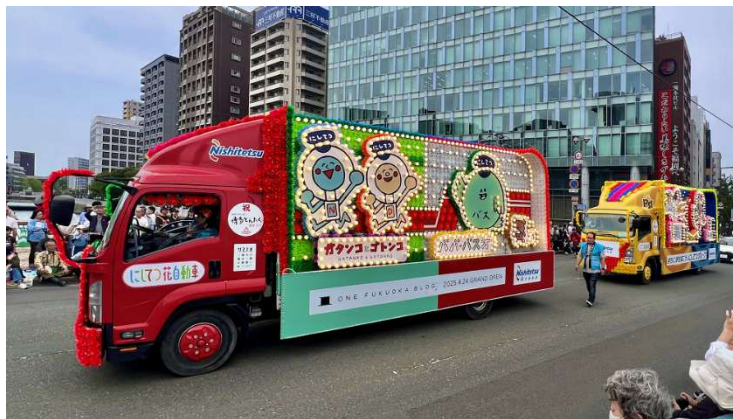
昨年の運行の様子

※2「トイ・ストーリー」シリーズ最新作の『トイ・ストーリー5』は、7月3日(金)から全国劇場公開されます。