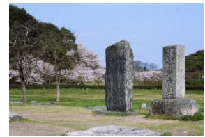
大宰府政庁跡