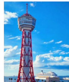
博多ポートタワー