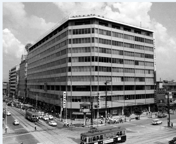
開業当時の福岡ビル

1961年12月31日に竣工した本ビルは、地上10階、地下3階建てで、当時は「西日本一のデラックスビル」とも言われ、5階および6階に当社の本社が入居しました。当初、屋上にはヘリポートを設けていましたが、騒音等の問題によりこれを改装し、1962年に、屋上と10階デッキにビアガーデンを開店しました。