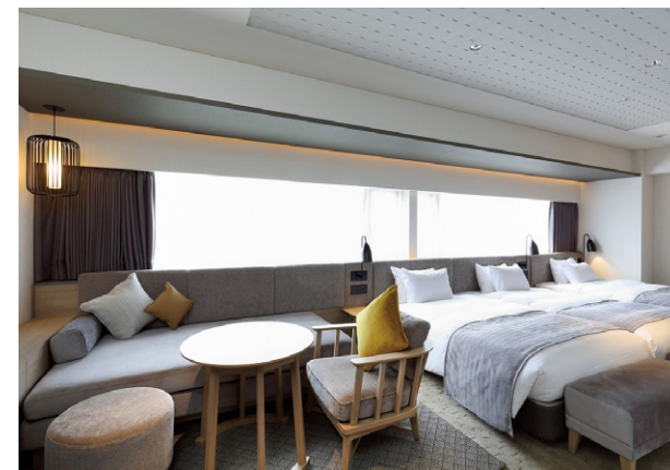
新設した客室(デラックストリプル)

10月には、レストランフロアにおいて、Bar「Trans blue (トランスブルー)」、鉄板焼「Asagi(あさぎ)」をリニューアル