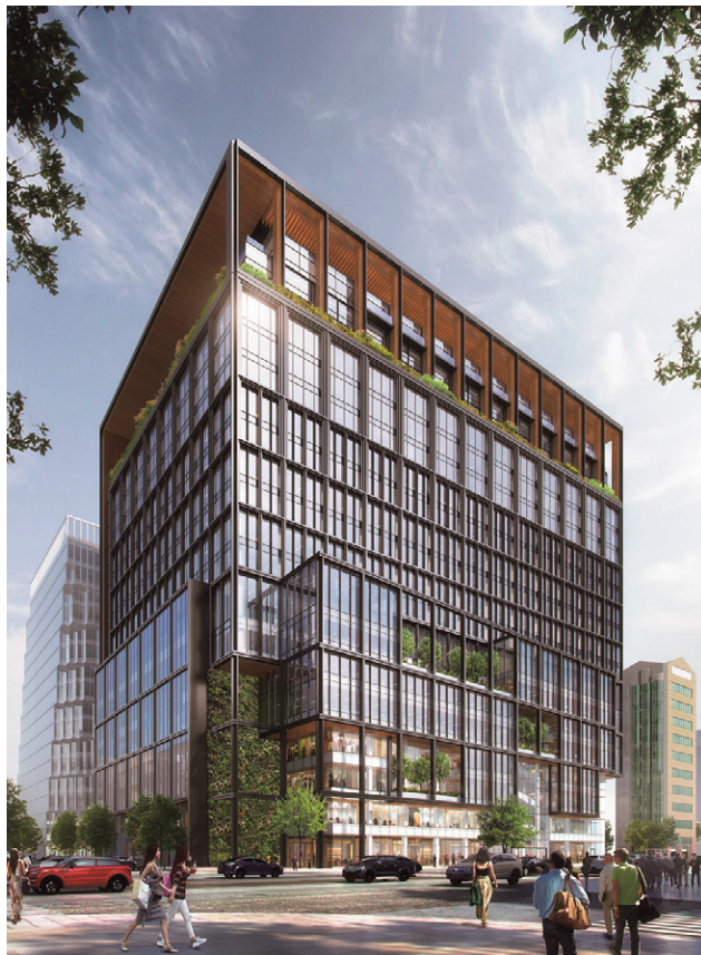
建物外観イメージ(天神交差点より)

開発コンセプトは、「創造交差点 meets different ideas」です。アジアゲートウェイ、九州一の商業エリア、職住近接のコンパクトシティといった特徴を活かしたヒト、モノ、情報の交差によって、常に新しいビジネスと文化を生み出します。新しいまちのブランドを示すことで、福岡天神を「来街者とワーカー自ら主体となって創造と文化を楽しむまち」に変革させることを目指します。