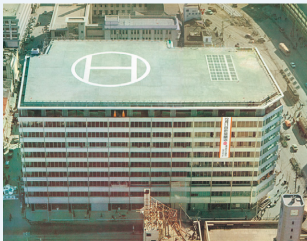
屋上に設置されたヘリポート

また、翌年には、9階に結婚式場を開設するなど、その立地の良さから、オフィスビルにとどまらず活用されました。