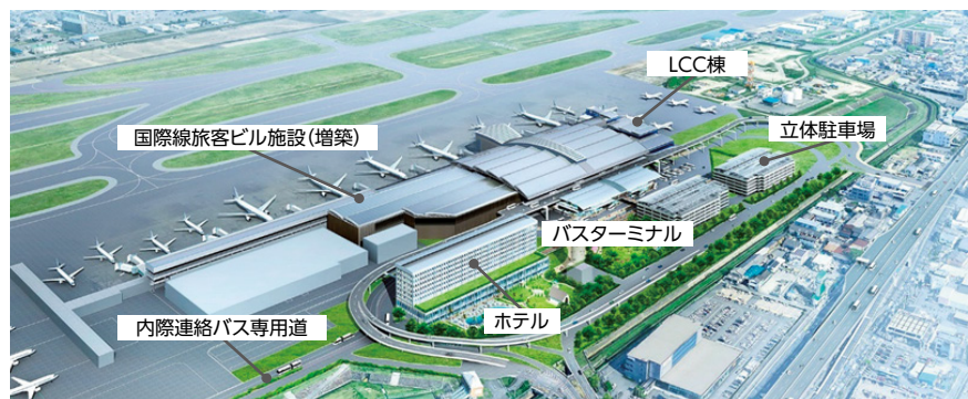
将来の福岡空港イメージ(国際線地区)

国際空港(株)が2018年11月にビル施設事業を開始しており、2019年4月より空港運営事業を開始する予定です。