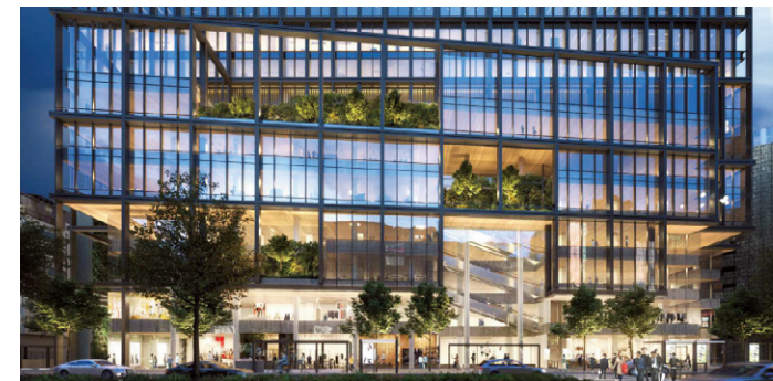
建物外観イメージ(渡辺通りより)